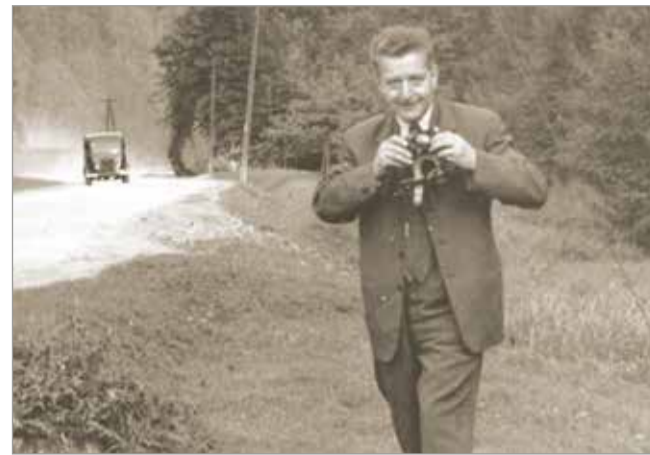
François-Georges Pariset

À l'occasion du quarantième anniversaire de la disparition de François-Georges Pariset, professeur d'histoire de l'art à la Faculté des Lettres de Bordeaux de 1952 à 1974, et du dépôt récent à l'INHA d'une part importante de ses archives personnelles, cette journée d'étude entend réexaminer son apport à l'histoire de l'art. Conservateurs et universitaires reviendront sur sa carrière et ses travaux, depuis la monographie consacrée à Georges de La Tour (1948) jusqu'aux études sur l'histoire de l'architecture bordelaise du XVIII e siècle. Une proposition du Centre François-Georges Pariset (EA 538), de l'Université Bordeaux Montaigne, de Passages (UMR 5318), de l'École nationale supérieure d'architecture et de paysage de Bordeaux. Retrouvez le programme détaillé sur le site du musée.