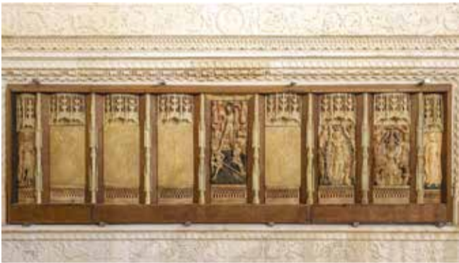
Albâtres de la basilique St-Michel.

Les jeudis 17 septembre, 1 er octobre et 15 octobre, 15 heures [Départ du musée d'Aquitaine]