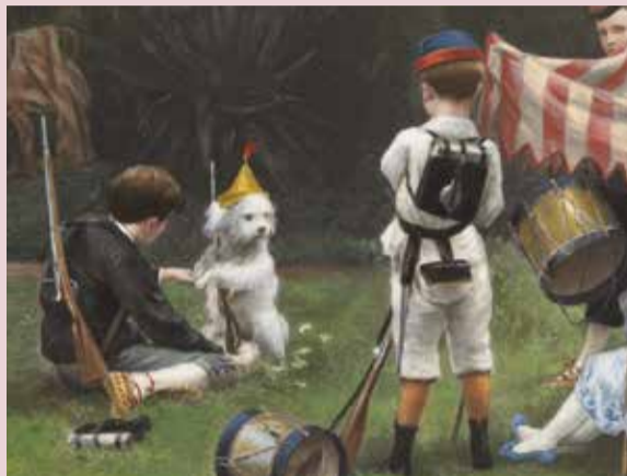
L'involontaire d'un an, d'après Rudaux, coll. musée Goupil