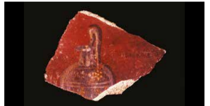
Fragment d'enduit peint (représentant une oenochoé), Bordeaux, fouilles des allées de Tourny, 1973.

Programme : www.peinture-murale-antique.fr