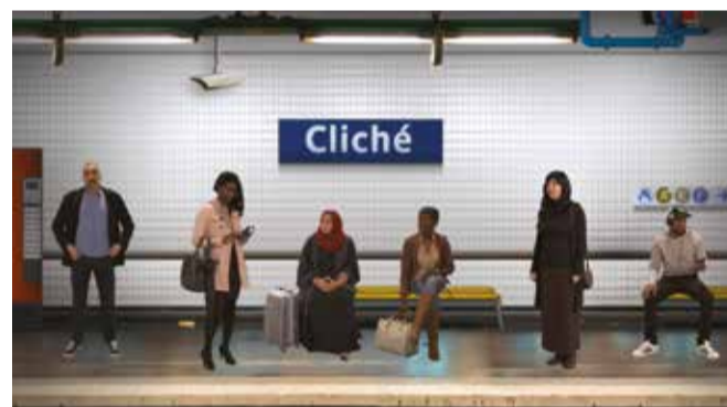
Visuel tiré de l'exposition du MNHN - Musée de l'Homme « Nous et les autres. Des préjugés au racisme »