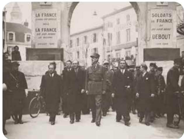
Visite du général de Gaulle à Périgueux le 5 mars 1945.

Si la Dordogne présente de nombreuses similitudes avec la Nouvelle-Aquitaine durant cette période, le département n'est pas dépourvu de spécificités.