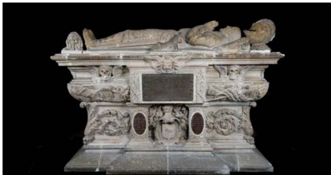
Le cénotaphe de Michel de Montaigne

Le musée d'Aquitaine remercie les nombreux contributeurs et partenaires de la campagne de financement participatif lancée en 2016 pour la restauration et la mise en valeur du cénotaphe de Michel de Montaigne. Grâce à cette belle mobilisation, la restauration du monument pourra débuter à l'automne 2017, au musée. Nous vous invitons à suivre l'actualité du projet sur le blog dédié www.pourmontaigne.fr , qui continuera d'être alimenté jusqu'à la réouverture de la salle Montaigne.