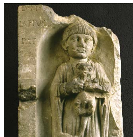
Stèle funéraire d'une fillette