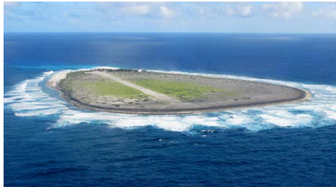
Vue aérienne de l'île de Tromelin

Parti de Bayonne en novembre 1760 pour rejoindre l'île de France (actuelle île Maurice), l'Utile, navire de la Compagnie française des Indes orientales, fait naufrage quelques mois plus tard au milieu de l'océan Indien. Son équipage, ainsi que 88 des 160 esclaves achetés frauduleusement au cours d'une étape à Madagascar, échouent sur un îlot désert. Grâce à l'épave de l'Utile, l'équipage parvient à fabriquer une embarcation de fortune. Il regagne les côtes malgaches, laissant derrière lui les esclaves, avec la promesse de revenir bientôt.