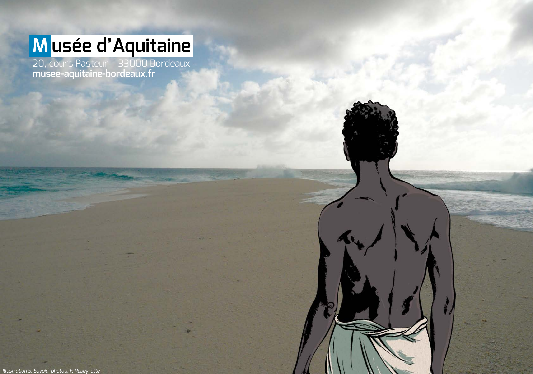
Illustration S. Savoia

20, cours Pasteur – 33000 Bordeaux musee-aquitaine-bordeaux.fr