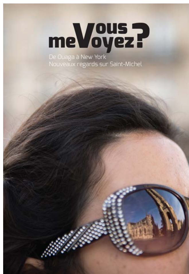
Couverture du livre - catalogue de l'exposition.

Elles et ils ont en commun d'être arrivés à Bordeaux en provenance d'autres pays, depuis quelques mois ou quelques années, et de se croiser à Saint-Michel. Pour cette exposition, avec chacun sa sensibilité, sa culture et son expérience, ils ont écrit et photographié pour dire ce qu'ils voyaient ici, dans un quartier historiquement populaire, qui est en train de changer, de se gentrifier dit-on. Un regard qui implique pour eux des allers-retours entre ce quartier français et l'Espagne, la Syrie, le Mali, les États-Unis, l'Inde, l'Algérie, l'Italie, le Burkina Faso et l'Argentine. Les visions de ces nouveaux Bordelais sont libres et singulières, elles invitent à se décaler des bruits du temps présent.