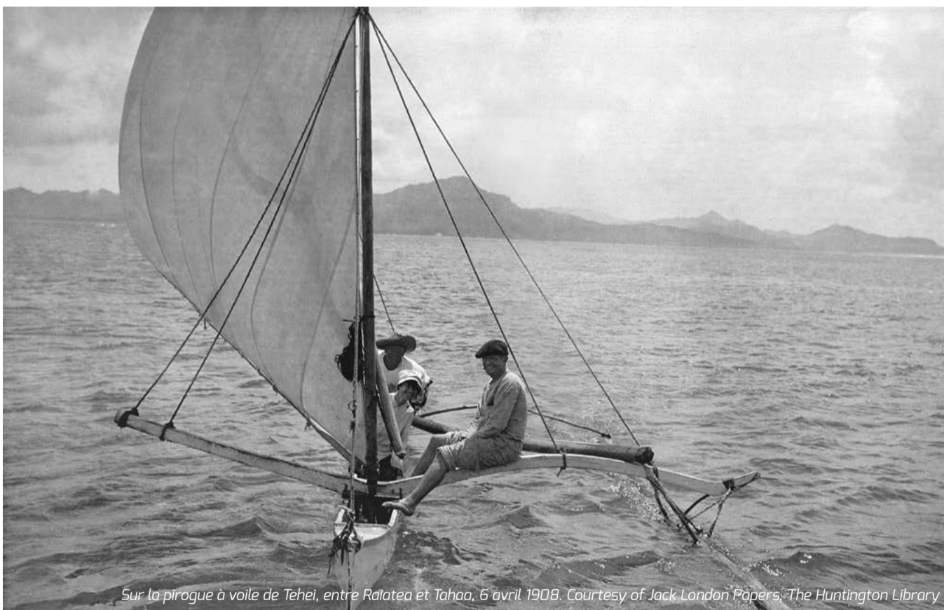
Sur la pirogue à voile de Tehei, entre Raiatea et Tahaa, 6 avril 1908.

Présentée en 2017 à la Vieille Charité de Marseille, cette exposition est une invitation au voyage et à l'aventure, symboles de la vie et de l'œuvre de l'écrivain américain Jack London. Réalisée par le Musée d'Arts Africains, Océaniens, Amérindiens (MAAOA), en coproduction avec la Compagnie des Indes, elle propose de revivre l'un des paris les plus audacieux de London : la traversée du Pacifique Sud entreprise en 1907 sur son voilier le Snark, de San Francisco à Sydney, avec sa femme Charmian, un capitaine, un mécanicien, un cuisinier et un garçon de cabine. Une expédition de plus de 12 000 km, faite de rencontres qui alimenteront quantité de récits et nouvelles.