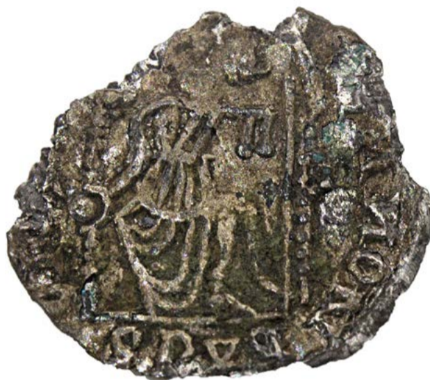
Demi-silique au nom d'Honorius, frappe wisigothique (ou imitation d'une frappe wisigothique) émise après 418-423