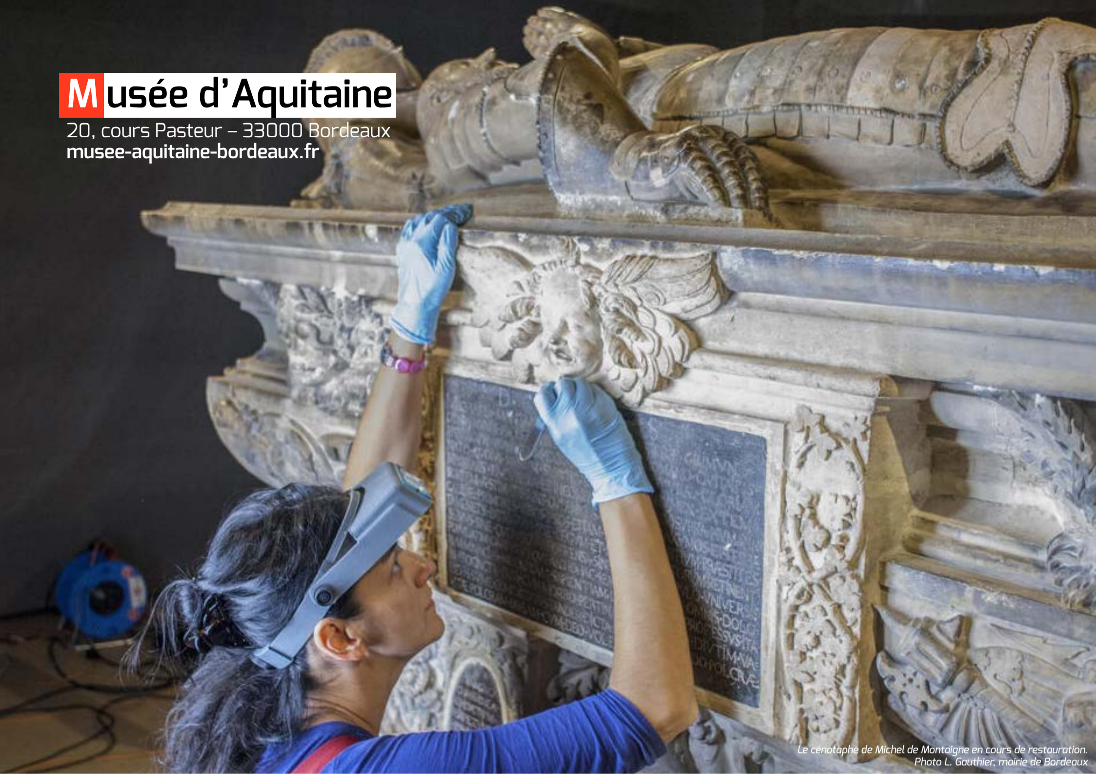
Le cenotaphe de Michel de Montaigne en cours de restauration.

20, cours Pasteur – 33000 Bordeaux musee-aquitaine-bordeaux.fr