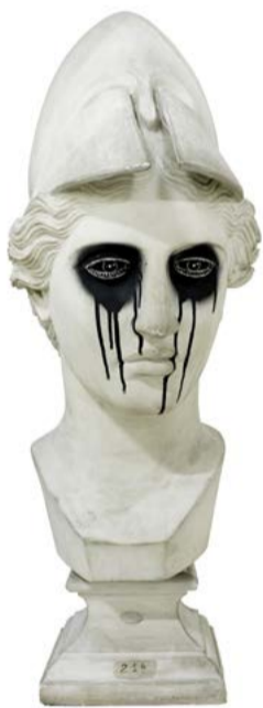
Moulage d'une Athéna taguée en mai 68. Coll. de l'Université Bordeaux-Montaigne.

Projection suivie d'un débat avec la réalisatrice et Pierre-Jean Roca, ingénieur de recherche rattaché au laboratoire Les Afriques dans le monde.