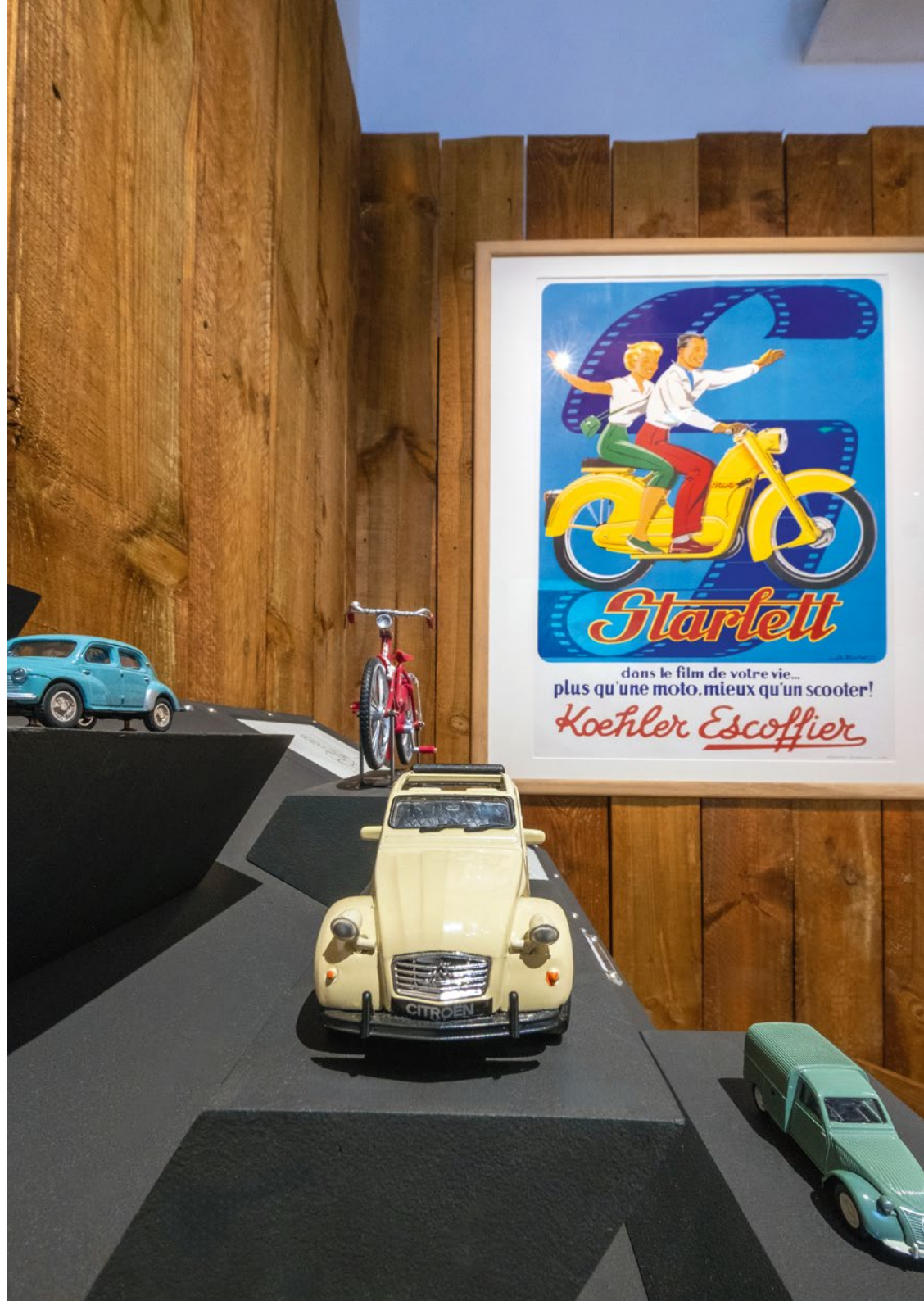
► Vue de l'exposition