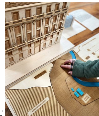
► Maquette tactile

17 et 23 décembre à 14h Visite commentée du centre d'interprétation Bordeaux Patrimoine Mondial Prêts pour une petite escale au cœur du patrimoine bordelais ? En compagnie des commissaires de l'exposition, venez découvrir l'exposition mais aussi ses coulisses. 5 €, gratuit Carte jeune Sans réservation