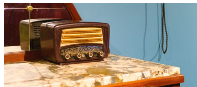
◀ Vue de l'exposition