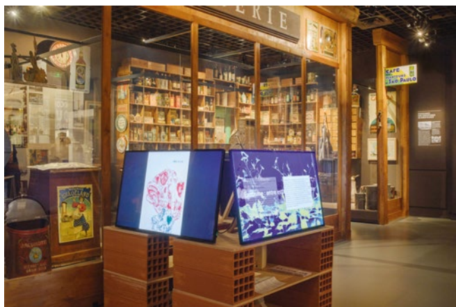
► Vue de l'installation dans les salles « Bordeaux, Port(e) du monde, 1800-1939 »

Des visites commentées sont proposées par les étudiants de l'école supérieure des beaux-arts de Bordeaux le dimanche 21 septembre de 15h à 18h, dans le cadre des Journées européennes du patrimoine et du patrimoine.