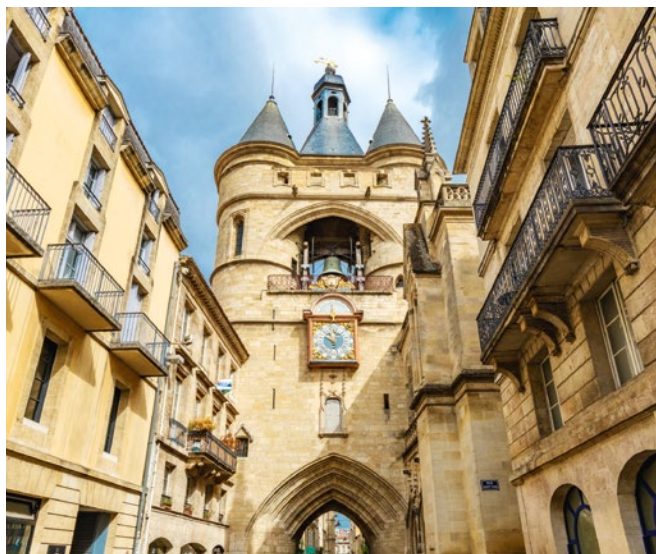
► Porte Saint-Éloi, Grosse cloche.

Par Bordeaux Patrimoine Mondial Rdv place du Palais 3€, gratuit Carte jeune (règlement espèces ou chèque) Réservation : mediation.bpm@mairie-bordeaux.fr