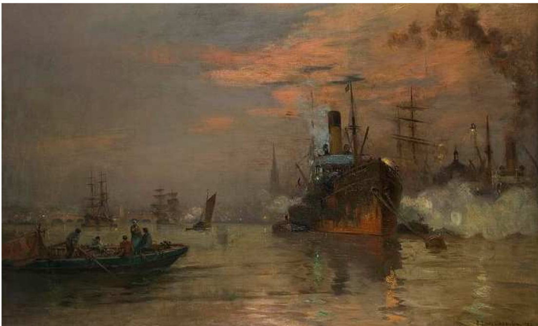
Le port de Bordeaux au soleil couchant, Pierre-Louis Cazaubon, 1921, collection musée d'Aquitaine

Ouverture des nouvelles salles permanentes du musée d'Aquitaine / 1 er mars 2014