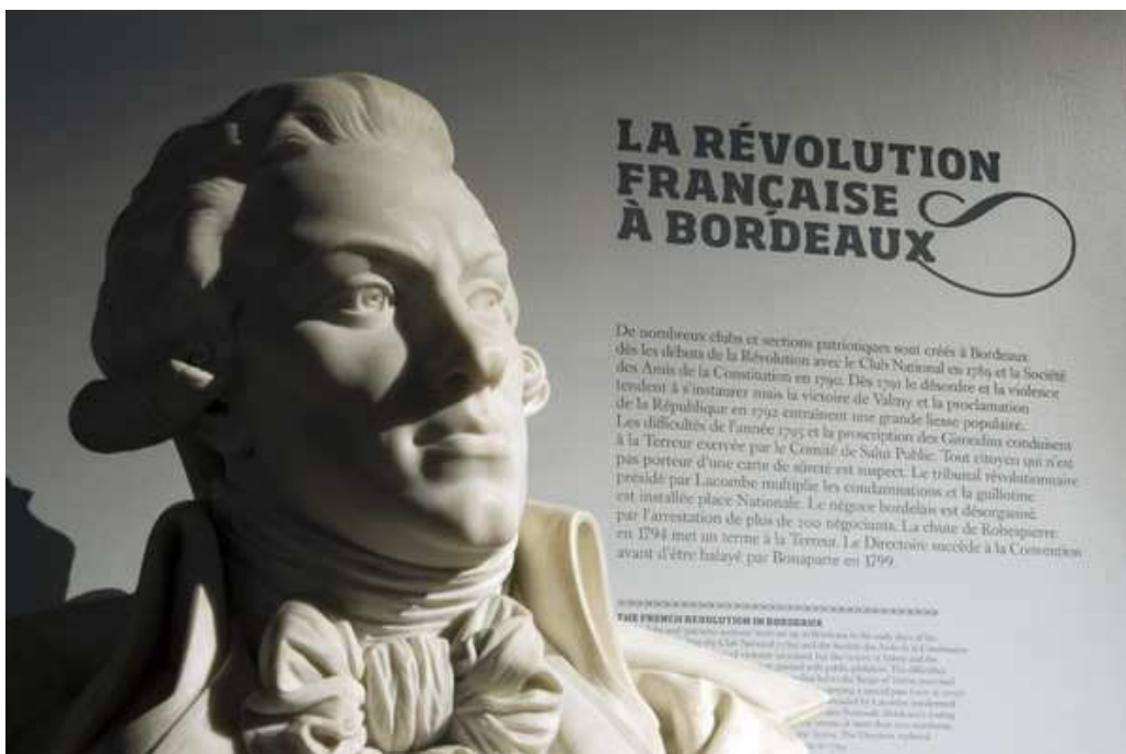
Salles XVIIIe / espace 4

Au-delà de ses spécificités propres qui permettent de comprendre les mécanismes et les enjeux de cette période complexe fondatrice de notre république, cet espace assure également la transition muséographique et historique entre les salles consacrées au XVIIIe siècle et celles consacrées au XIXe siècle.