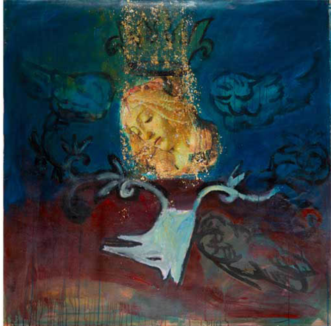
« Queen XV » technique mixte sur toile 200x200cm, 2011, collection privée 2014 © Daniel Dabriou