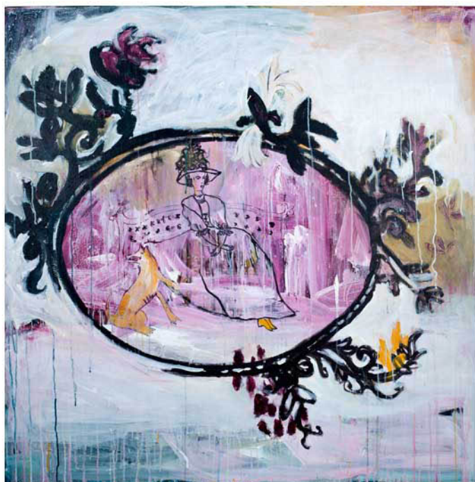
« Les commodités de la conversation I » crayon, huile, acrylique sur toile 150x150cm, 2013 2014