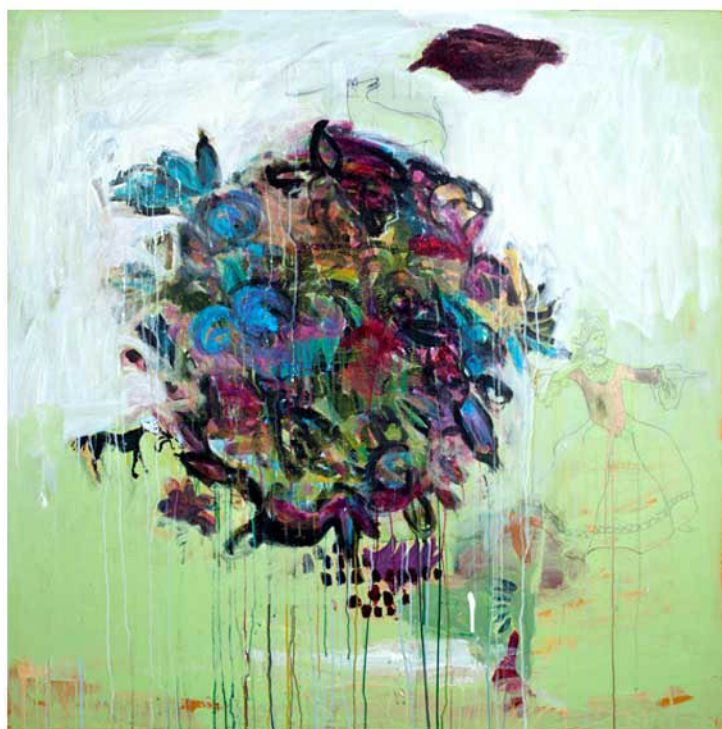
« Les commodités de la conversation IV » crayon, huile, acrylique sur toile 150x150cm, 2013 2014