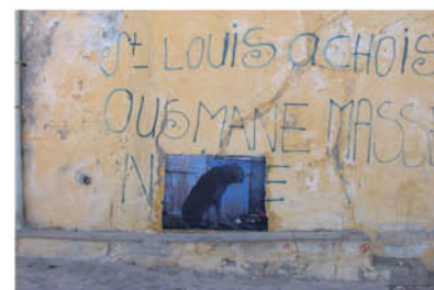
« Le chien fou ou la poétique de l'errance » sérigraphie, Saint-Louis, Sénégal 2004 © Guy Lenoir