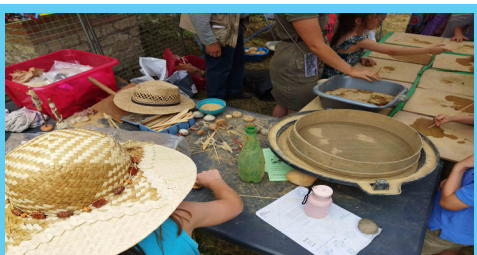
Atelier - De l'argile pour tisser ? : lors des Journées européennes de l'archéologie 2023

Un atelier pour découvrir le travail des archéologues/anthropologues, autour d'analyses de tombes anciennes. Présenté par les archéologues de l'Inrap. Atelier en continu.