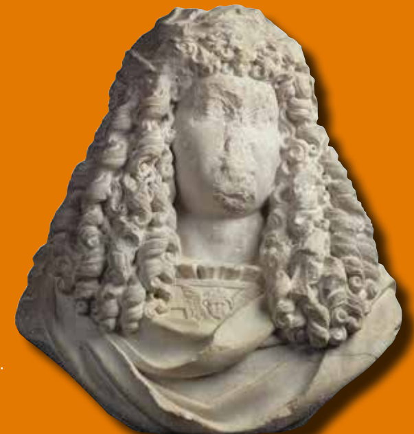
Buste de Louis XIV Buste provenant de l'ancien château Trompette de Bordeaux. Quatrième quart du XVII e siècle, calcaire en ronde bosse