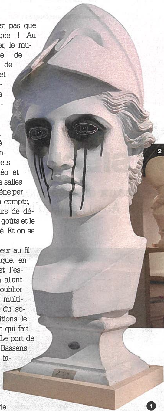
1. Le buste d'Athéna, maquillé en mai 68

elles éclairent chaque salle de leur puissance évocatrice, avec chacune un thème majeur racontant l'Aquitaine : la forêt landaise, l'activité portuaire, l'agriculture et la vigne. Toutes dans des tons gris et rouges, elles reflètent le goût de l'époque Art déco et des allégories classiques. Elles ont été sauvées par le musée d'Aquitaine, et, une fois rénovées, elles ont trouvé naturellement place dans la nouvelle aile. Ce qui est très plaisant, c'est la grande diversité