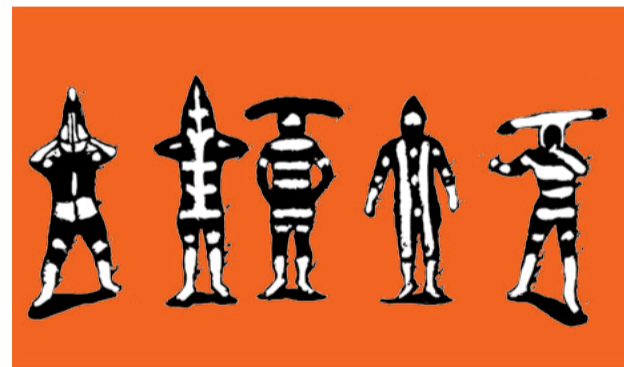
Laurent Chiffolleau, Peuple Onas, Terre de feu.

Entrée comprise dans le billet d'accès aux collections permanentes