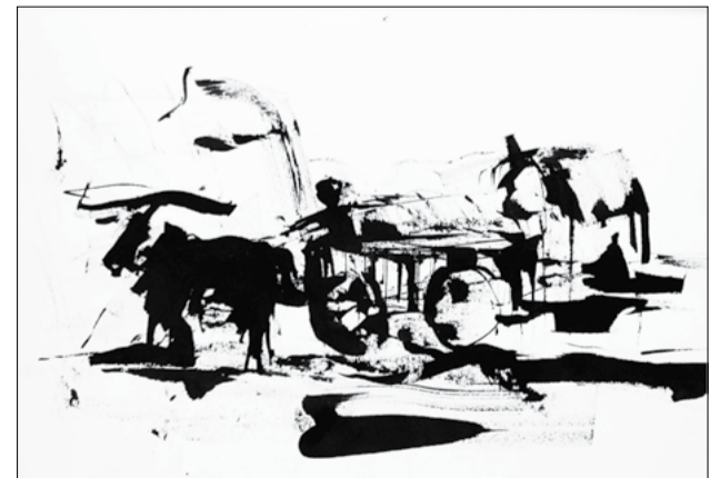
Laurent Chiffolleau, Char aux algues , encre sur papier, 2014

60 ans après la mort du saxophoniste Charlie Parker et 30 ans après la disparition de Cortazar, les deux artistes se rencontrent à Paris ou dans l'au-delà pour échanger sur le temps en musique et en littérature. Ils sont habités par le désir brûlant d'approcher le métier de l'autre. La mise en scène présente en lecture trilingue (français, espagnol et anglais) un échange sur la naissance des œuvres, les aspirations vers l'univers pluridisciplinaire, le tout ponctué par l'acceptation des dures conditions du réel.