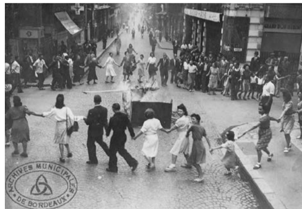
Libération Bordeaux.

Le 28 août 1944, la liesse populaire envahissait les rues de Bordeaux enfin libérée après quatre longues années d'occupation, d'oppression, de vexations, de restrictions et d'exactions. L'immense espoir suscité par le débarquement des alliés le 6 juin 1944 devenait enfin réalité avec le départ des dernières unités allemandes selon les principes négociés entre les FFI et le commandement militaire allemand encore en place à Bordeaux.