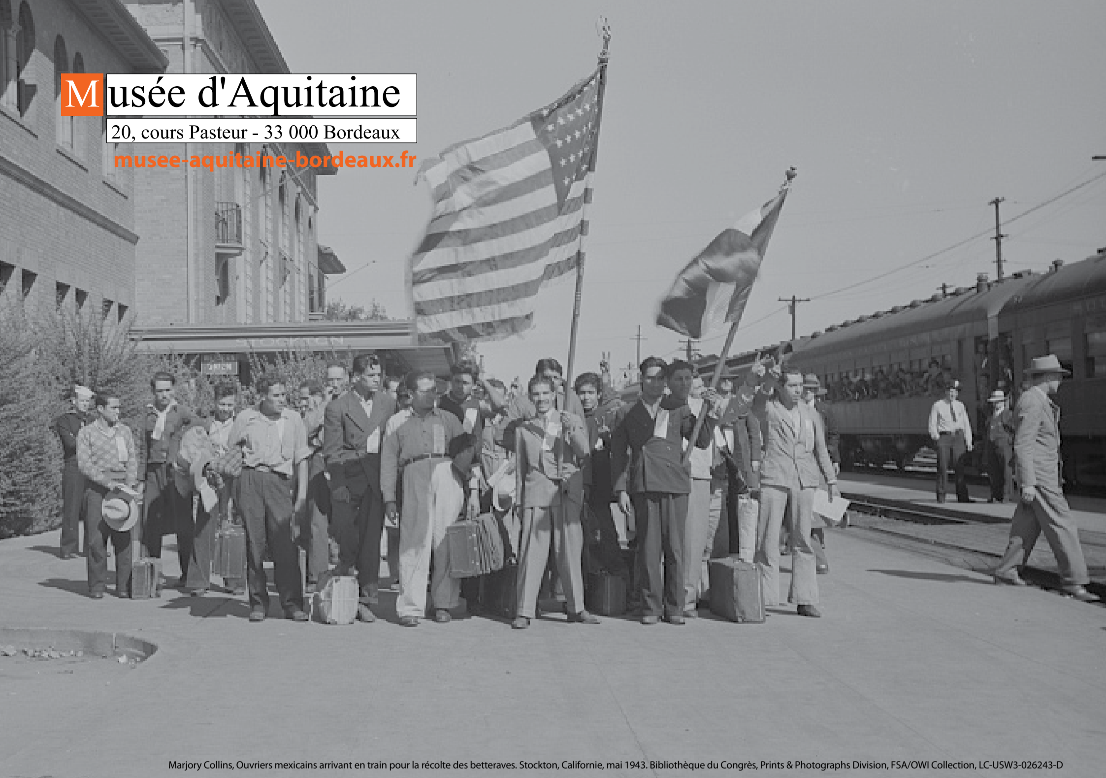
Marjory Collins, Ouvriers mexicains arrivant en train pour la récolte des betteraves. Stockton, Californie, mai 1943. Bibliothèque du Congrès, Prints & Photographs Division, FSA/OWI Collection, LC-USW3-026243-D